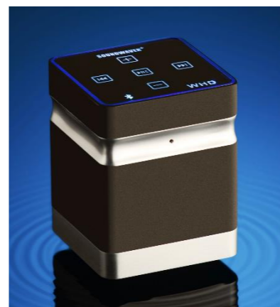
Photo : l'enceinte à vibration SoundWaver+ Bluetooth 26w - Design et Performance